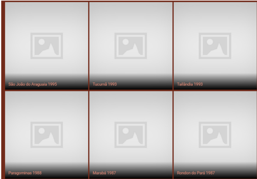
Figura 3 – Remontagem I: invisibilidade icônica