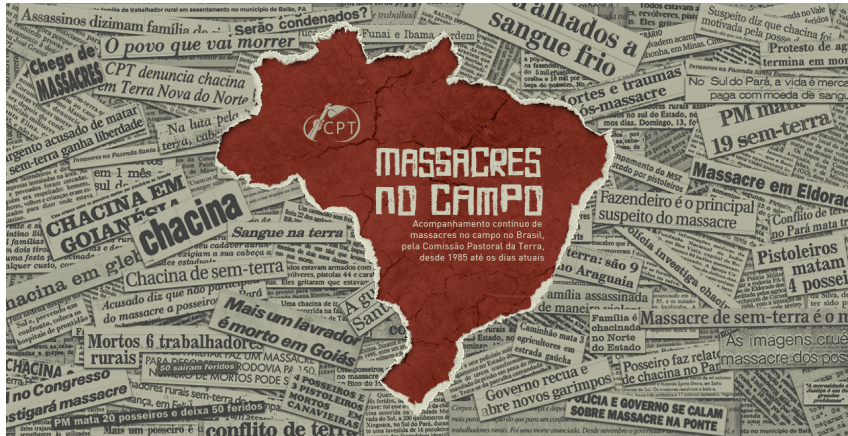
Figura 1 – Capa da página “Massacres no Campo”