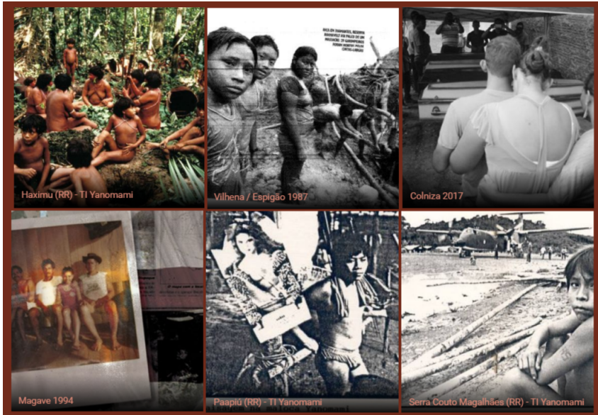
Figura 6 – Remontagem IV: sobrevivência das imagens, dos povos e dos conflitos