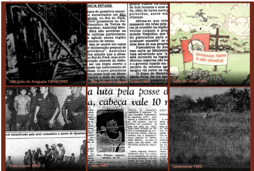
Figura 5 – Remontagem III: inicialidade do acontecimento