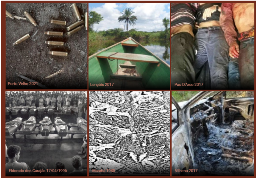
Figura 4 – Remontagem II: indicialidade da violência