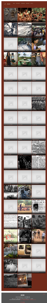
Figura 2 – Prancha de imagens de massacres no campo pela CPT