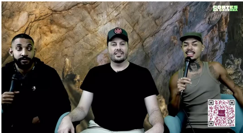
Figura 1 – Cenário semelhante a gráfico de videogame no podcast Caverna do Ogro